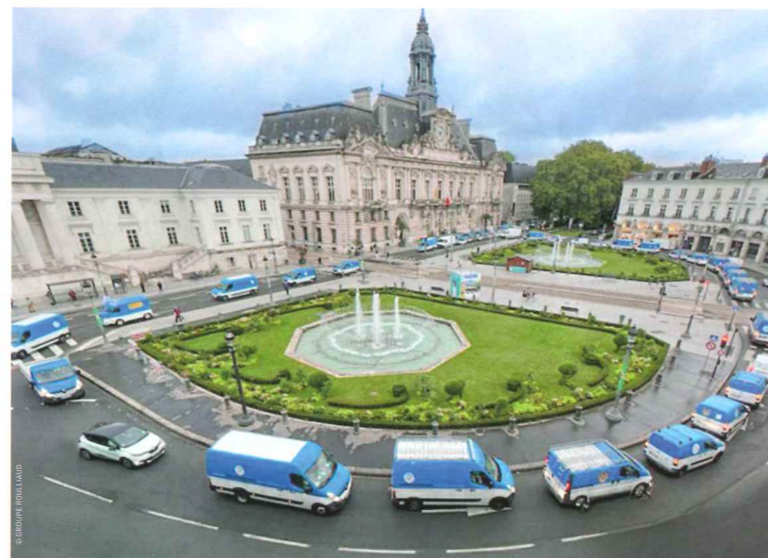
▲ UN CORTÈGE DE 70 VÉHICULES EST DESCENDU EN DIRECTION DE L'HÔTEL DE VILLE DE TOURS

Si le Groupe Roulliaud connaît une belle pérennité depuis 70 ans, c'est aussi parce qu'il a toujours su s'engager pour les générations futures, entretenant notamment un lien très fort avec les territoires. Cet engagement durable se manifeste de multiples