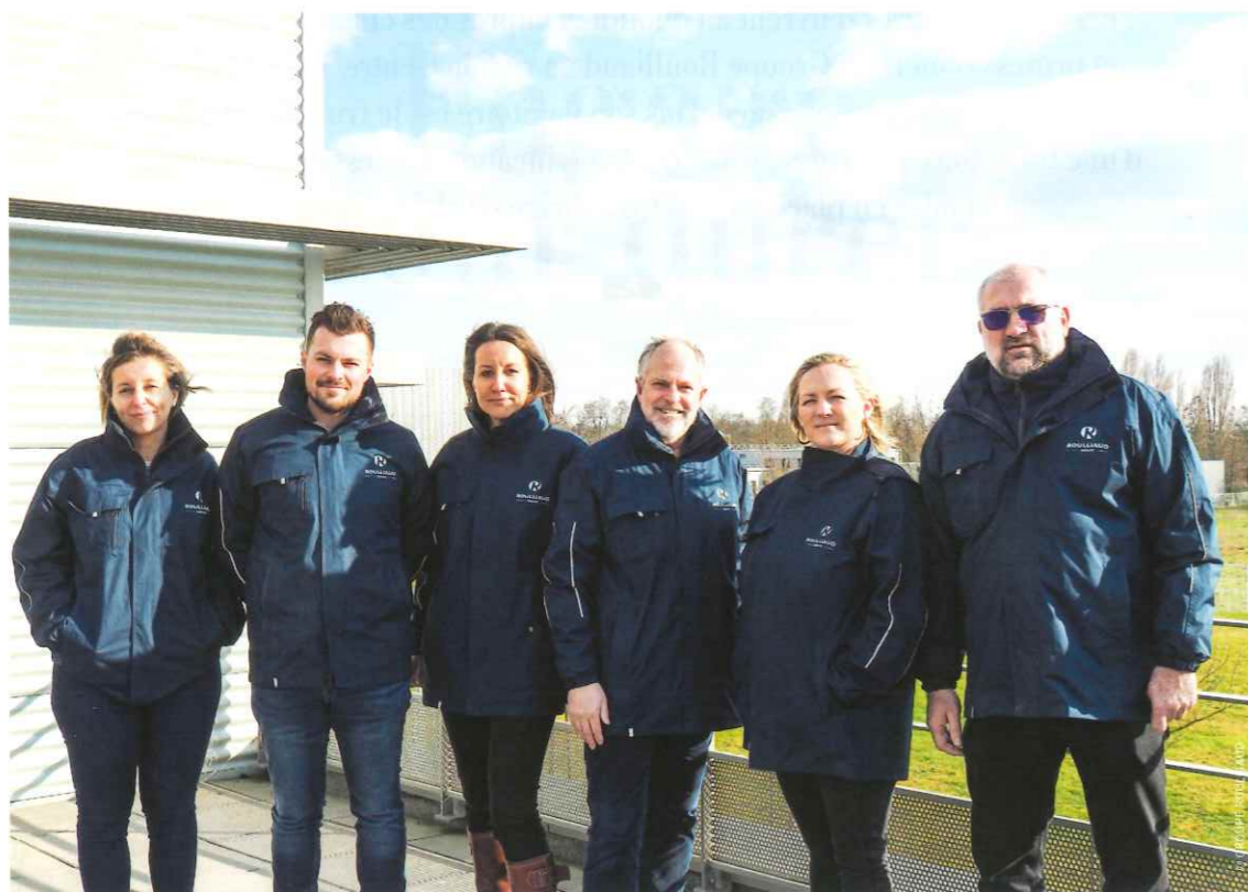
▲ COMITÉ DE DIRECTION DU GROUPE ROULLIAUD